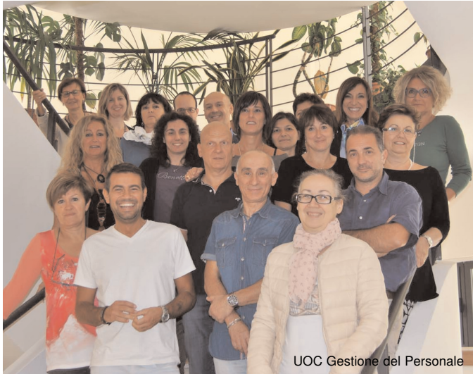
UOC Gestione del Personale

Grazie a tutti i dipendenti impegnati nel percorso PEO 2015