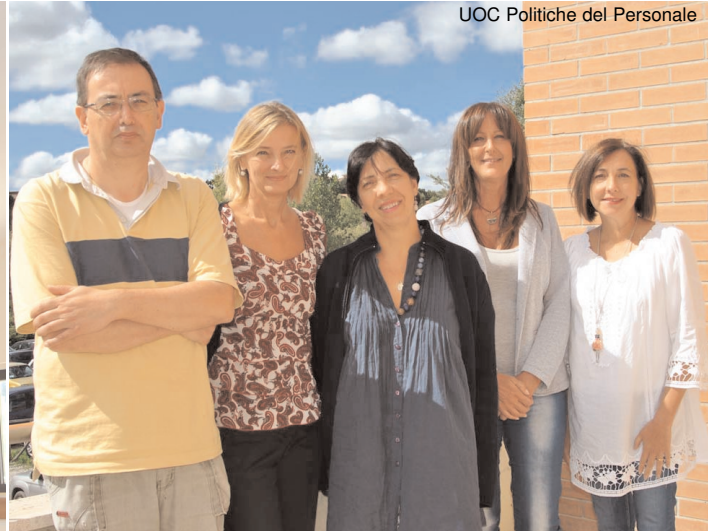
UOC Politiche del Personale

Si è concluso il 30 ottobre il bando per richiedere le progressioni economiche orizzontali 2015.