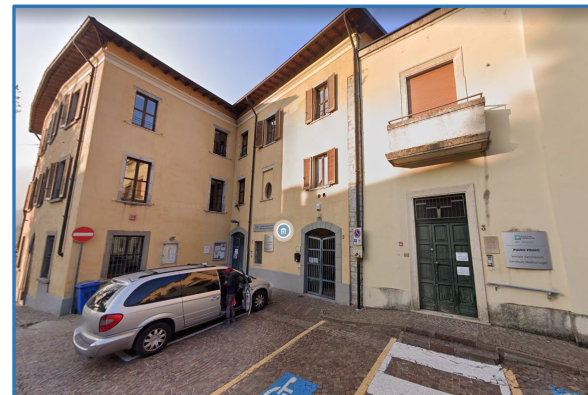
CdC Zogno Open day 13 novembre 2023