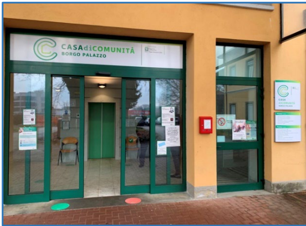
CdC Borgo Palazzo Attiva dal 25 febbraio 2022