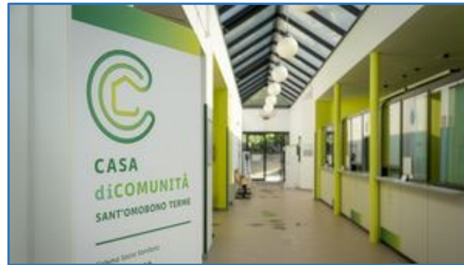
CdC Sant'Omobono Attiva dal 22 luglio 2022