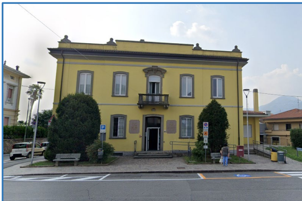
CdC Villa d'Almè Open day 1 marzo 2023