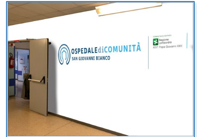
Odc San Giovanni Bianco Attivo dal 19 dicembre 2022