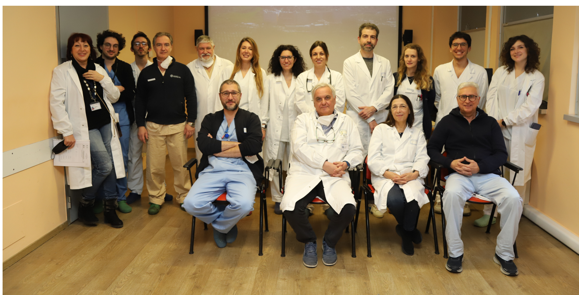
FOTOAFERESI (ECP) nel Trapianto Cardiaco